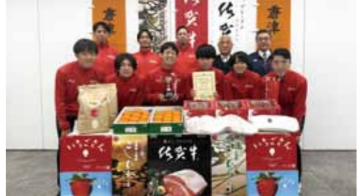
▲贈呈をうけたサンベルクス陸上部と関係者ら

サンベルクス(東京都)陸上部は1月19日、株式会社サンベルクス本社でニューイヤーマラソン報告会を開き、JAからつが佐賀牛など農畜産物を贈呈しました。