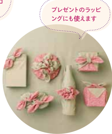
プレゼントのラッピングにも使えます

メリット1 形を選ばず、何でも包める 箱や瓶、野菜など形や大きさの違うものも1枚で対応。荷物に合わせて形を変えられます。