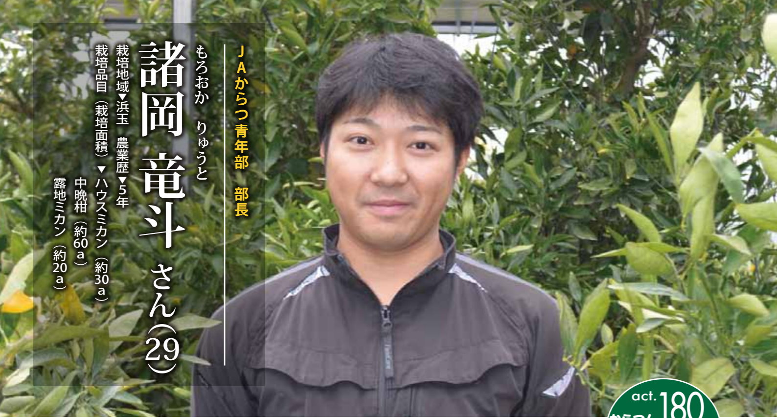
JAからつ青年部 部長