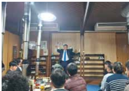
▲挨拶をする古川康衆議員

1月24日にJAからつ青年部とJA伊万里青年部で毎年行っている東西松浦地区青年部交流会が伊万里市のドライブイン鳥で開催され、JAからつから青年部本部委員9名が参加しました。