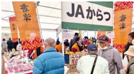
▲JAからつのブースの様子

農業イベント「さが農業まつり」(JAグループ佐賀主催)が1月29日から2月1日まで佐賀市川副町の佐賀空港東特設会場で開催されました。農業機械をはじめ、旬の県産農畜産物、園芸、焼き肉、自動車展示など多彩なコーナーが設けられ、キャラクターショーやよさこいなどのイベントもあり初日から多くの来場者で賑わっていました。