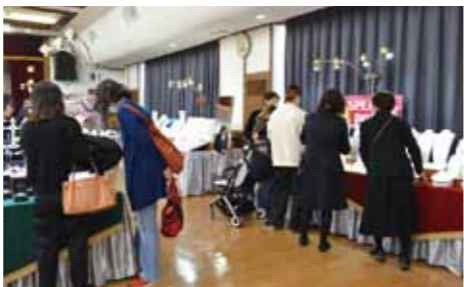
▲ジュエリーを見る来場者

JAからつは2月20日・21日の2日間、当JA本所で麗宝展を開き、多くの来場者で賑わいました。麗宝展は、毎年開催しており、今年で18回目になります。