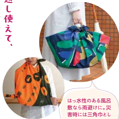
はっ水性のある風呂敷なら雨避けに。災害時には三角巾としても活用できます

メリット3 いざというときにも役立つ 買い物や外出時を持っていれば、さっと取り出して使えます。1枚あると安心な日本の知恵です。