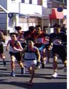
▲町内一周駅伝大会の様子

JAからつは2月22日、唐津市浜玉町で行われた第68回浜玉町内一周駅伝大会に出場しました。この大会は町内約20kmを7区間に分け、浜玉町内や中高校生など17チームのエントリーがあり、当JAからは若手職員や陸上愛好会で構成したメンバーで出場しました。